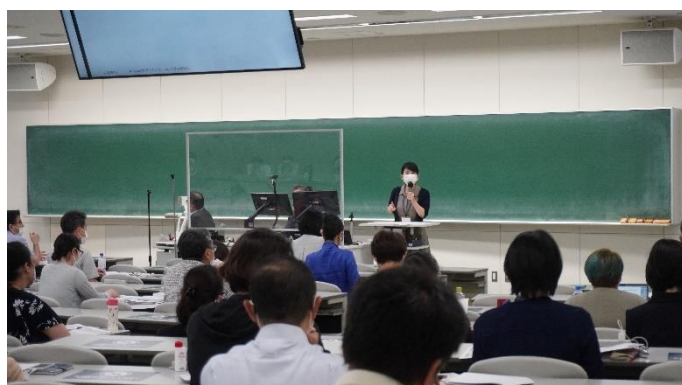
学部説明（アジア太平洋学部）