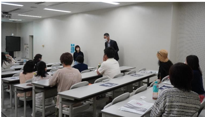
交流会（アジア太平洋学部）