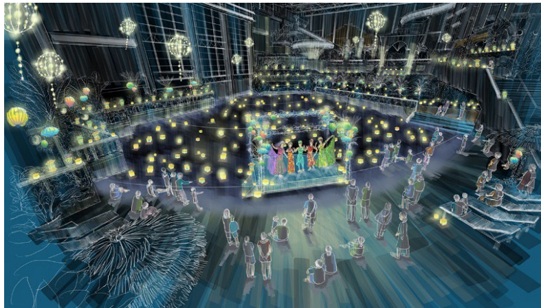
マルチカルチュラル・フェスティバル in 杉乃井ホテル（イメージ）

オリックス不動産株式会社（本社：東京都港区、社長：深谷 敏成）、立命館アジア太平洋大学（所在地：大分県別府市、学長：出口 治明、以下「APU」）および杉乃井ホテル&リゾート株式会社（所在地：大分県別府市、社長：似内 隆晃）は、2022年11月25日（金）～27日（日）の期間、業界初 *1 となる学生が企画・運営するホテルイベント「マルチカルチュラル・フェスティバル in 杉乃井ホテル」を開催しますのでお知らせします。