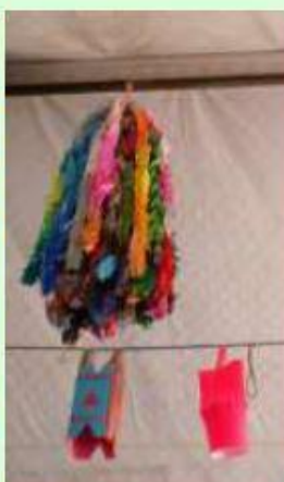
シリアの子ども達による 千羽鶴とイラスト「シリアの未来」