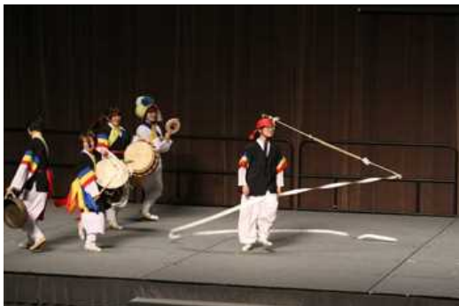
韓国のサムルノリ

その後、APUのサークル団体による歓迎パフォーマンスが続きます。APUには様々な国・地域の伝統文化サークルがあり、初めて目にするパフォーマンスに、多くの新入生が驚きの表情で見入っています。