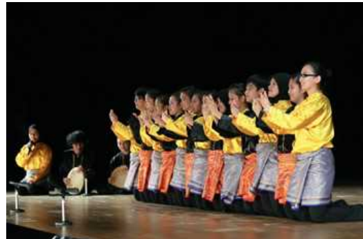
インドネシアのサマンドンス