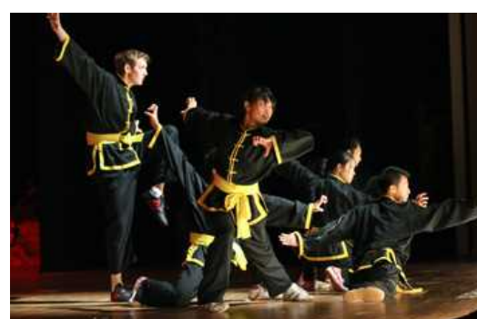
ベトナムのベトナム武道