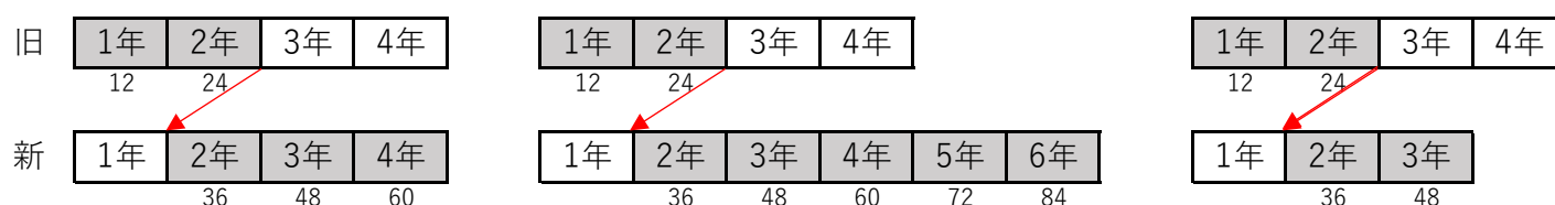
例③修業年限が短縮する

●「旧」は転学・転学部（科）前の旧在籍課程を、「新」は転学・転学部（科）後の新在籍課程を示します。